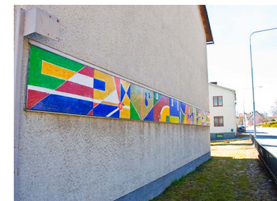
13. Konstverket Festremsan