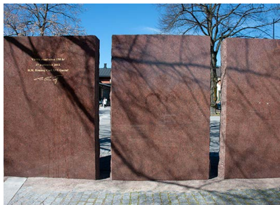
4. De tre monoliterna