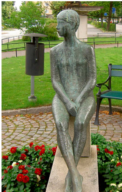
2. Statyn 17 år