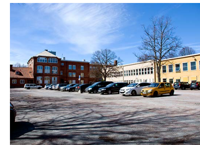
12. Västra skolan

Längs med gatan rinner den centrala Rösättersbäcken. De flesta kallar emellertid bäcken för Puttlabäcken eller Puttlis.