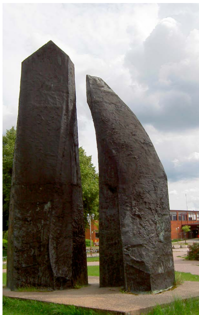
15. Skulpturen Tidig form