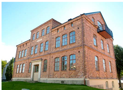
22. Östra skolan