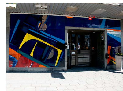
19. Väggmålning i emalj