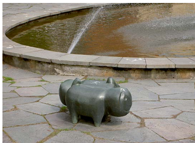
16. Park med djurstatyer