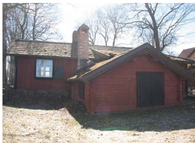
10. Bohmans Smedja