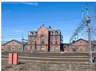
11. Boställshus och Lokstallar