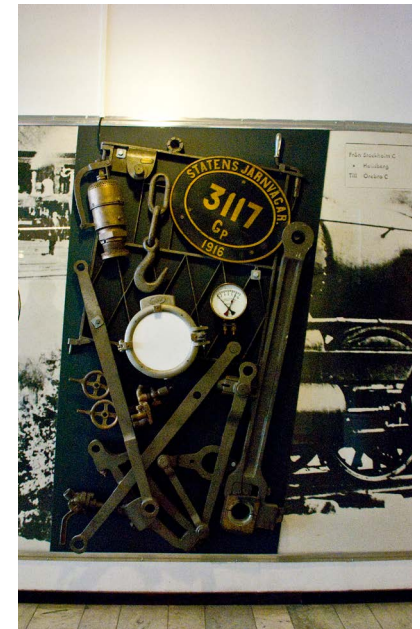
6. Konstverket Loket