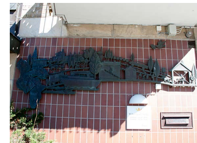
24. Konstverket - Brevets väg

Under 2000-talet revs hus nummer 3, men nummer 4 är återställd och Kronan nummer 5 håller på att renoveras.