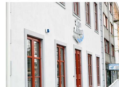
25. Kronan (3), 4 och 5