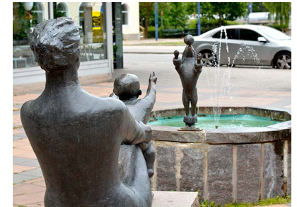
5. Fontän med staty

På 1950-talet byggdes huset om till förvaltningshus.